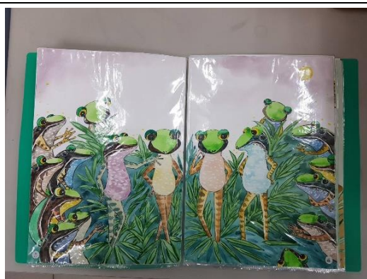
手繪作品原稿依序放入資料夾提交 (勿裝訂、打孔)