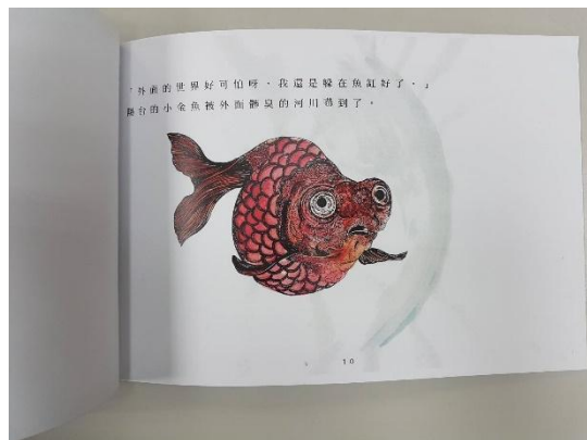
樣書範例(A4 彩印加文字頁碼)