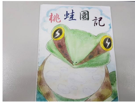
作品原稿(請勿書寫文字及頁碼)