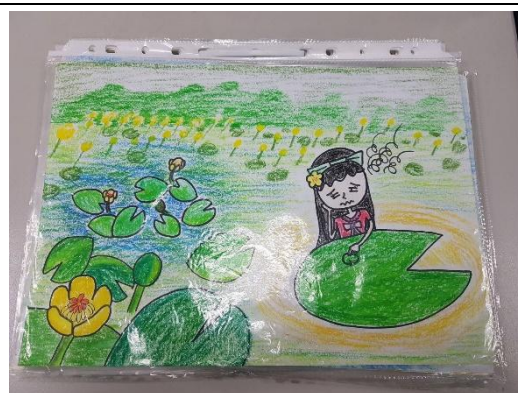
手繪作品原稿依序放入資料夾提交 (勿裝訂、打孔)