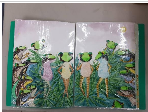
手繪作品原稿依序放入資料夾提交 (勿裝訂、打孔)