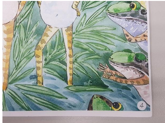
彩色影印樣書(文字編排貼上)