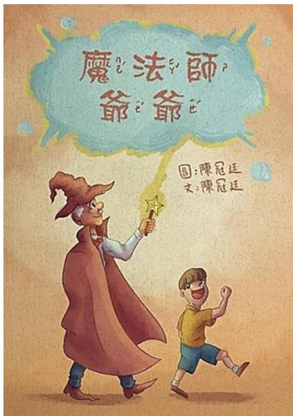
作品規格-A4 尺寸直式 (高 29.7cm×寬 21cm)