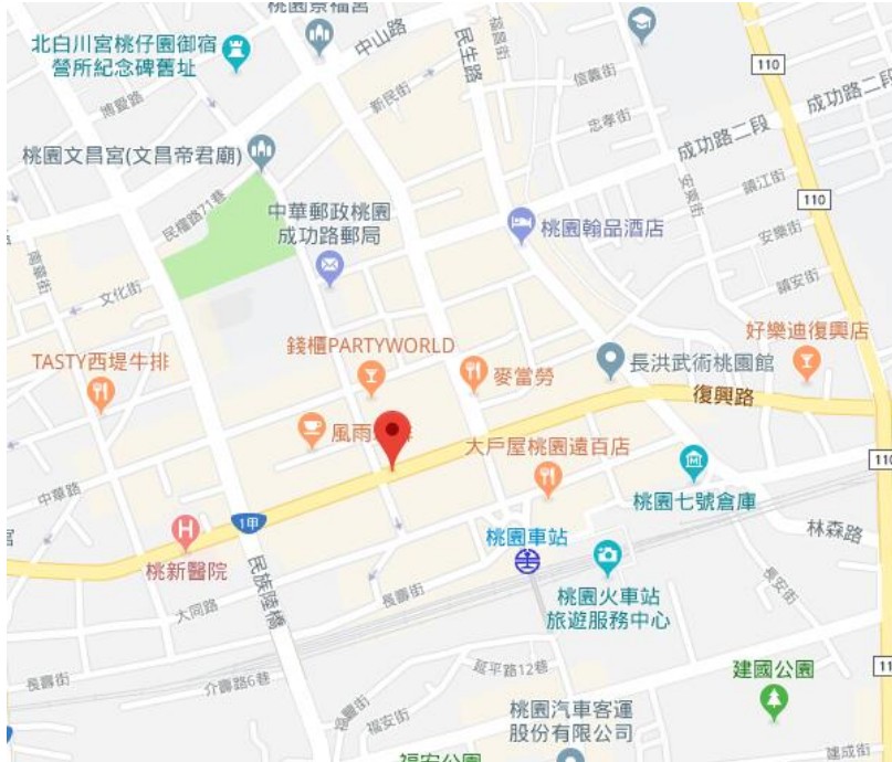
圖 2、思考致富教室 桃園教室 A 教室交通地圖