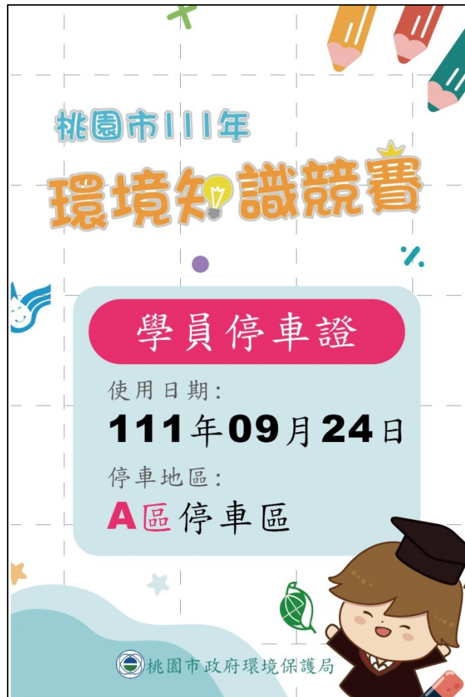
元智大學汽車停車證